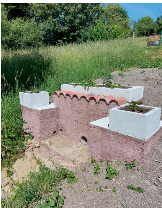
Capture des sources rue des jardins

----- L'équipe Municipale poursuit son action pour le bien vivre à LANEUVEVILLE DEVANT BAYON , reste à votre écoute et vous souhaite un très bel été.