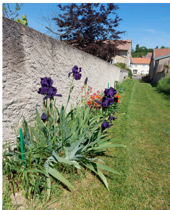
Sentier fleuri les ruelles